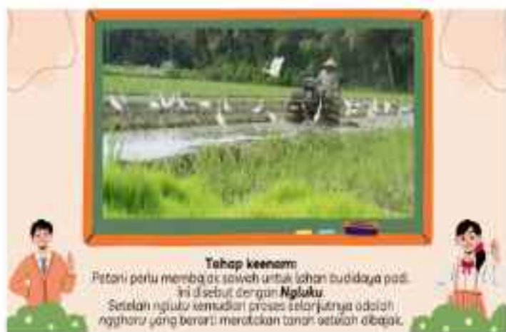
Gambar 1. Contoh muatan istilah budaya dalam video digital storytelling

Berdasarkan penjelasan di atas, dapat disimpulkan bahwa pengenalan istilah-istilah budaya yang mencerminkan kehidupan masyarakat setempat menjadi penting bagi anak-anak. Hal ini dikarenakan pengaruh globalisasi akan sangat berpengaruh terhadap penggunaan bahasa daerah di masa depan. Budaya yang tidak diajarkan melalui bahasa serta bahasa daerah yang mulai berkurang penuturnya akan membuat kekayaan budaya semakin terancam untuk tidak dikenali oleh masyarakatnya di masa mendatang. Oleh karena itu, sudah menjadi tugas kita untuk tetap menjaga kelestarian budaya dan bahasa daerah dengan terus mengajarkan dan memperkenalkannya kepada generasi penerus bangsa.