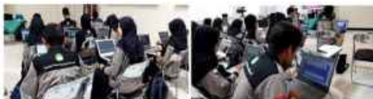
Gambar 3. Penggunaan Web Arabic Online di Kelas Bahasa Arab UIN Walisongo (Gambar telah terpublikasikan secara ilmiah) (Inayah et al., 2022)

metakognitif. Beberapa media interaktif yang pernah atau sedang diterapkan di UIN Walisongo dalam lingkup bahasa Arab, diantaranya penggunaan web Arabic Online milik https://arabic.seu.edu.sa/ , dan opexams , quizizz atau https://wayground.com/ , wordwall , socrative , untuk berbagai macam evaluasi formatif, sumatif, pendalaman, dan remidi. Gambar 3. Mewalki penggunaan web Arabic online pada kelas bahasa Arab UIN Walisongo.