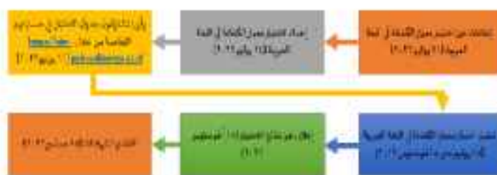
Gambar 2. Ikon edukatif yang dipampang di Pusat Bahasa mengenai Alur Pendaftaran Pre-Test Bahasa Arab 2022 (Gambar telah dipublikasikan secara ilmiah) (Inayah et al., 2023)

Dalam konteks pengajaran bahasa Arab, ikon dapat digunakan untuk menandai kesalahan morfologi, ketidaksesuaian gender atau jumlah, kesalahan sintaksis, serta pergeseran makna leksikal. Selain dalam konteks pembelajaran, Ikon edukatif idealnya juga tersedia di berbagai sudut dan tempat strategis yang diakses oleh banyak mahasiswa. Salah satu contohnya adalah informasi pendaftaran pre-test serentak mahasiswa UIN Walisongo, untuk ujian Bahasa Arab (IMKA) dan bahasa Inggris (Toefl). Gambar 2. Mewakili alur pendaftaran pre-test bahasa Arab tahun 2022.