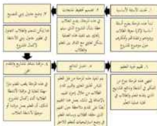
Gambar 4. Visualisasi Langkah PjBL (dipublikasikan oleh Khansa Nabila 2025) (Nabila et al., 2025)

Untuk visualisasi struktur teks ilmiah Arab, mahasiswa telah banyak memberi kontribusi melalui implementasi penulisan jurnal ilmiah, yang tidak sekedar tertuang dalam bahasa Arab, namun juga berbahasa Inggris.