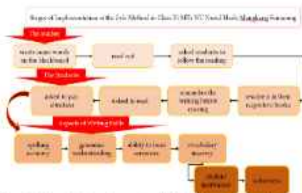
Gambar 7. Langkah Implementasi Metode Imla' yang diterapkan oleh Mahasiswa (Ni'mah et al., 2025)

Juga langkah implementasi metode Imla' , yang dianggap metode konvensional, namun dapat disajikan dengan cara yang terbaru oleh UZ Ni'mah.