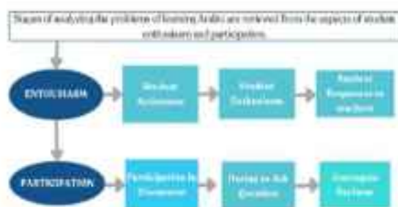
Gambar 6. Analisis Antusias dan Partisipasi Berbahasa pada Teori Charles Curran

Terdapat juga antusiasme dan partisipasi yang ditelaah oleh LN Muna dalam tulisannya (Muna et al., 2026), seperti yang tergambar pada Gambar 6.