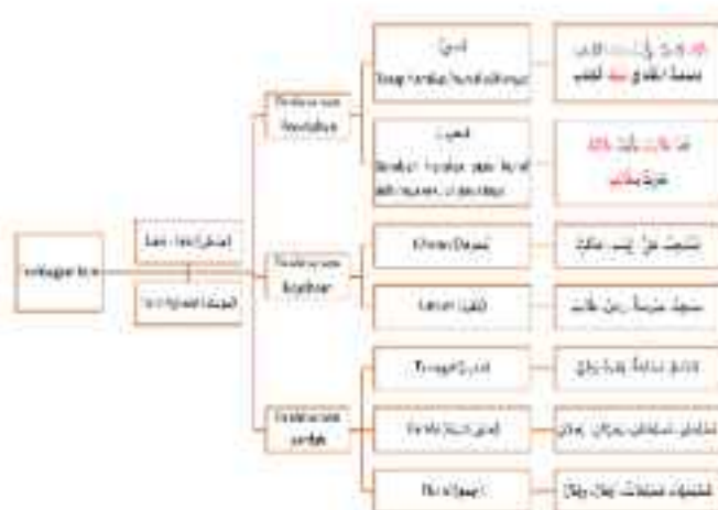
Gambar 1. Infografis Konseptual Pembagian Kata Benda Bahasa Arab (diambil dari buku ajar bahasa Arab UIN Walisongo terbitan PPB tahun 2020 hal. 23)

Berbeda dengan tabel atau teks naratif, infografis memberikan gambaran struktural yang bersifat global sekaligus relasional. Hal ini penting karena banyak kesulitan mahasiswa dalam bahasa Arab bukan terletak pada ketidaktahuan aturan, melainkan pada kegagalan melihat hubungan antar aturan tersebut. Contoh infografis sebagaimana tercantum dalam Gambar 1.